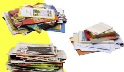
Journaux, revues et magazines sans les films plastiques