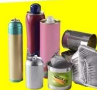
Emballages métalliques vides