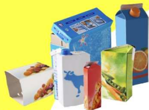
Cartons d'emballages et briques alimentaires