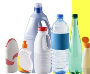
Bouteilles et flacons en plastique vides et avec bouchons