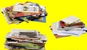
Journaux, revues et magazines sans les films plastiques