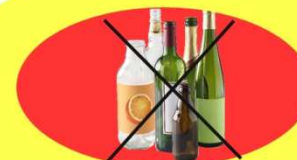
Je mets à l'éco-point