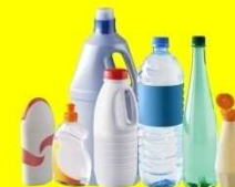
Bouteilles et flacons en plastique vides et avec bouchons