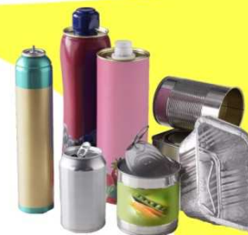
Emballages métalliques vides et non lavés