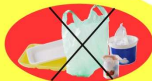
Je mets dans la poubelle ordinaire