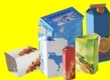
Cartons d'emballages et briques alimentaires